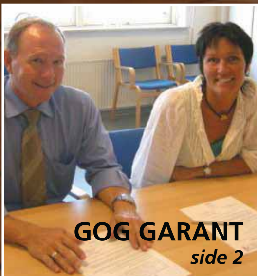
GOG GARANT side 2