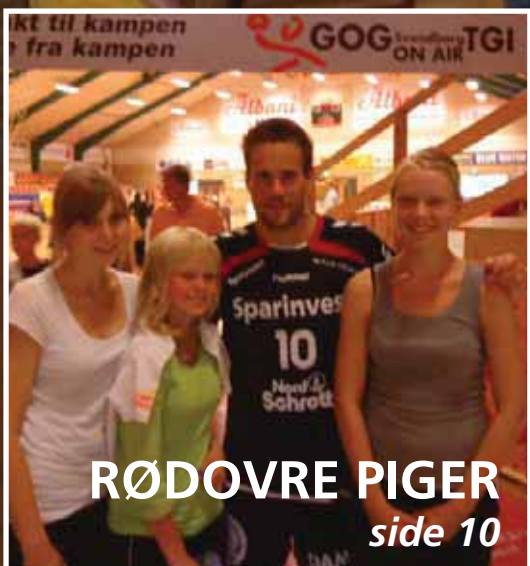
RØDOVRE PIGER side 10